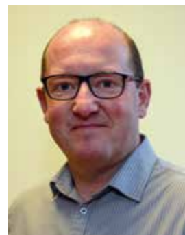
Lionel PRATZ Conseiller délégué à la transition numérique